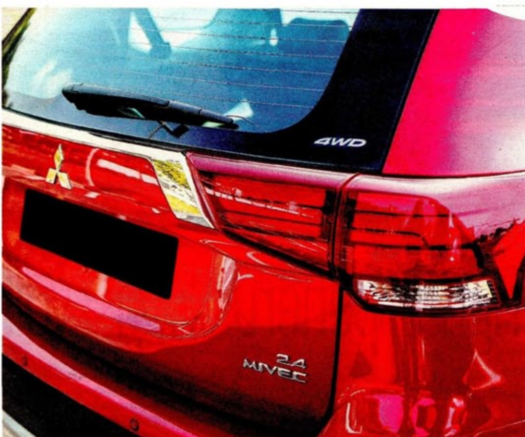
MITSUBISHI Outlander menarik untuk dipandang dari belakang.