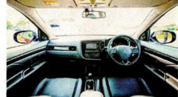
RUANG hadapan Mitsubishi Outlander kelihatan bergaya dan moden.