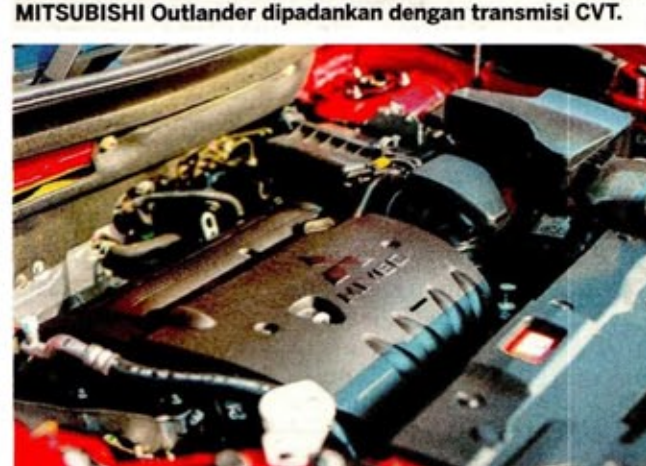
KUASA yang dihasilkan oleh enjin MIVEC cukup berkuasa.