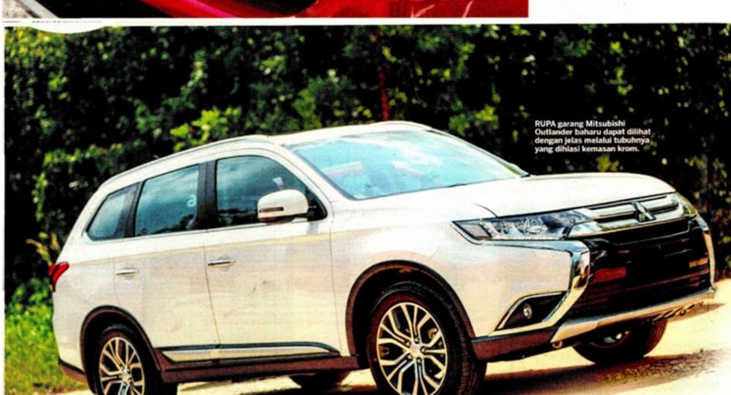
RUPA garang Mitsubishi Outlander baharu dapat dilihat dengan jelas melalui tubuhnya yang dilasi kemasan krom.