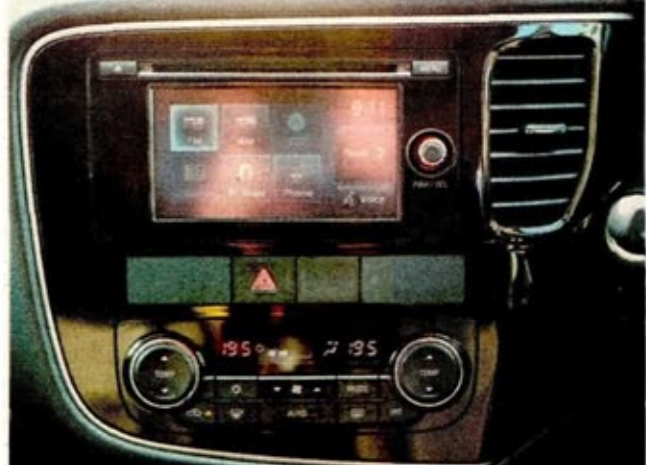
SKRIN infotainment Mitsubishi Outlander mudah untuk digunakan.