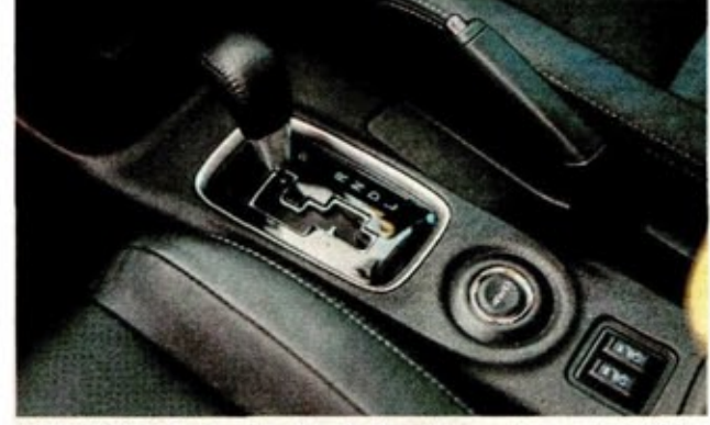
MITSUBISHI Outlander dipadankan dengan transmisi CVT.