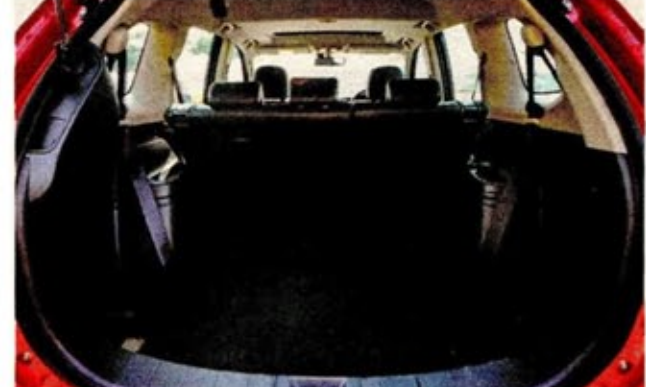
RUANG penyimpanan barangan Mitsubishi Outlander baharu mencapai 1,608 liter apabila tempat duduk kedua dan ketiga dilipat.